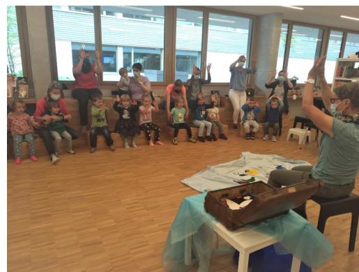
Buchstart in der Bibliothek

Die nächsten Buchstartanlässe finden am 13. September und 15. November 2021 statt.